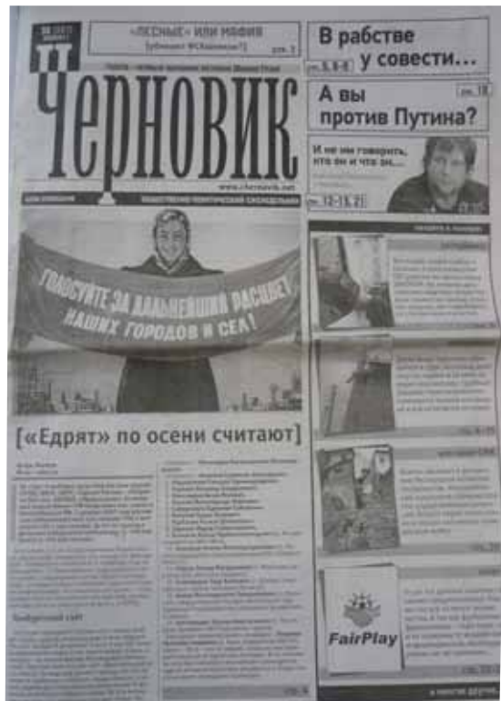
UNE DE TCHERNOVIK

Les journalistes, comme le reste de la population, sont pris en étau entre une insurrection islamiste qui décime les représentants du pouvoir au prix de nombreuses victimes civiles, et les exactions des forces de l'ordre. Mues par la vengeance, les « boïevye » (fortes indemnités versées en cas de participation à des opérations spéciales) ou l'attente d'une rançon, ces dernières multiplient les coups de force et les enlèvements. Une multitude de milices privées et de groupes mafieux semblent nourrir cet affrontement entre insurrection et forces de l'ordre.