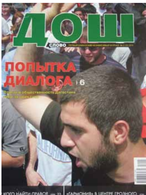
UNE DE DOSH

Le magazine Dosh ( Le Mot , en tchétchène), que Reporters sans frontières n’a pu trouver qu’à l’aéroport lors de sa visite à Grozny, présente pourtant un tableau différent.