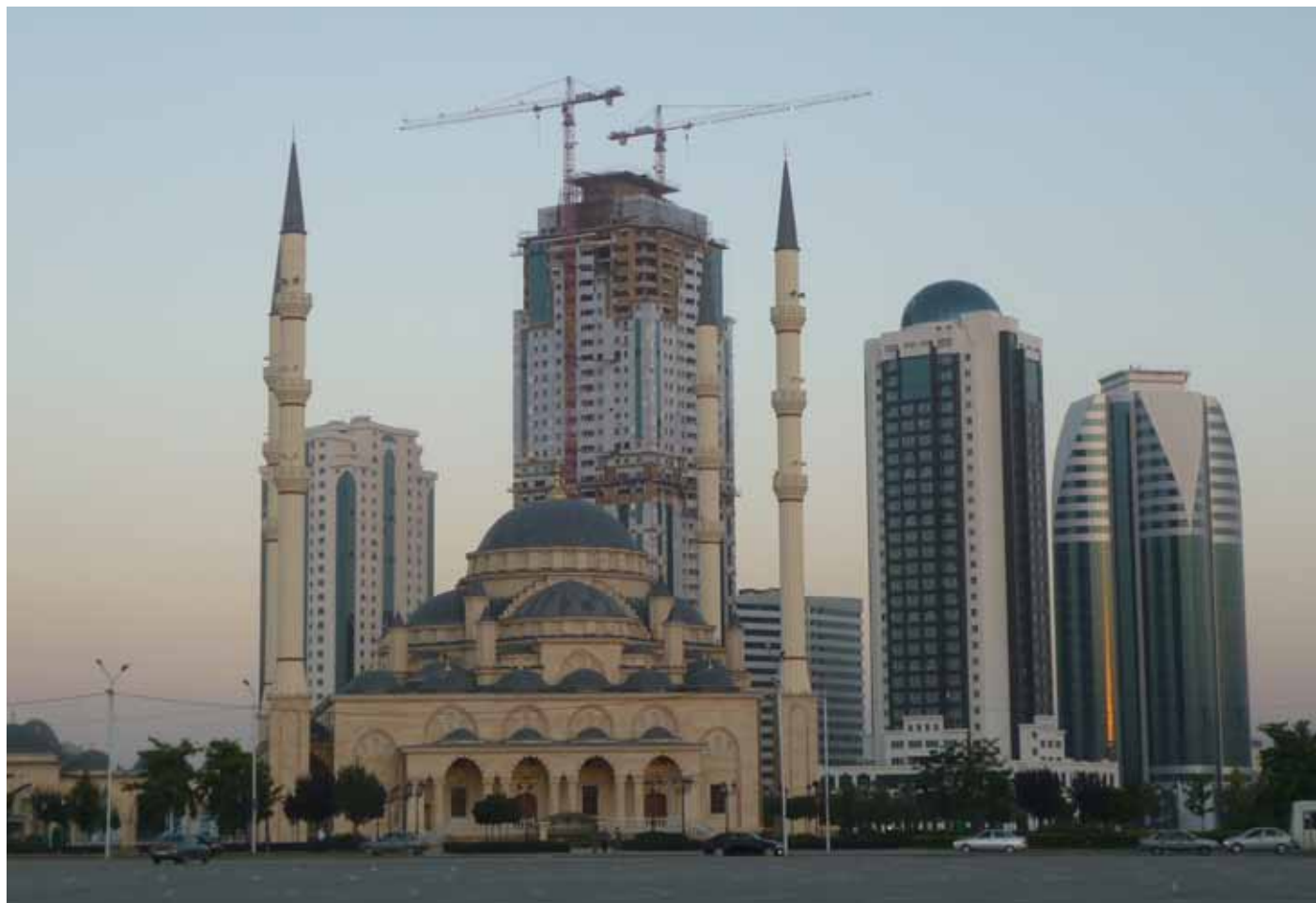
LE « NOUVEAU GROZNY » : LA MOSQUÉE CENTRALE ET LE CHANTIER DE « GROZNY CITY »