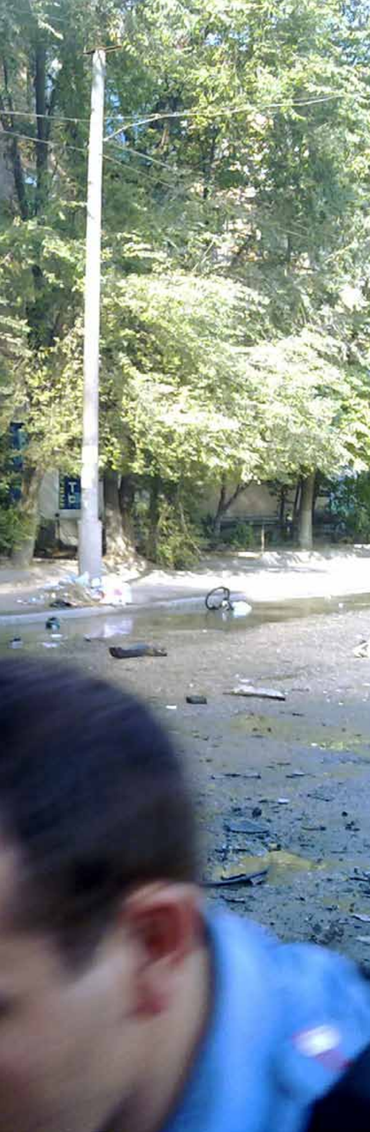
PHOTO DE COUVERTURE /// L'EXPLOSION D'UNE VOITURE PIÉGÉE À KIZLYAR (DAGHESTAN) A FAIT 12 MORTS, LE 31 MARS 2010.