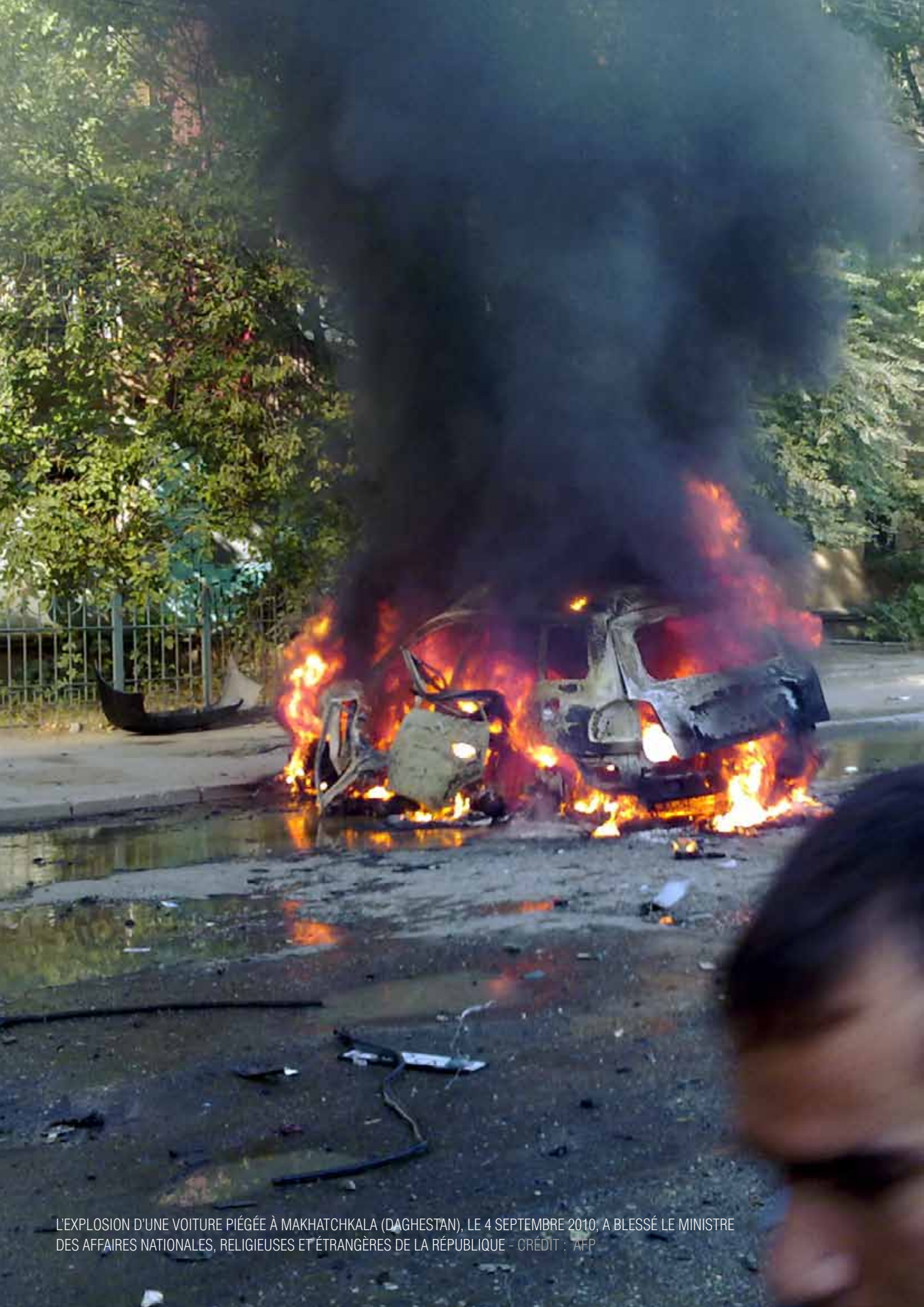
L'EXPLOSION D'UNE VOITURE PIÉGÉE À MAKHATCHKALA (DAGHESTAN), LE 4 SEPTEMBRE 2010, A BLESSÉ LE MINISTRE DES AFFAIRES NATIONALES, RELIGIEUSES ET ÉTRANGÈRES DE LA RÉPUBLIQUE