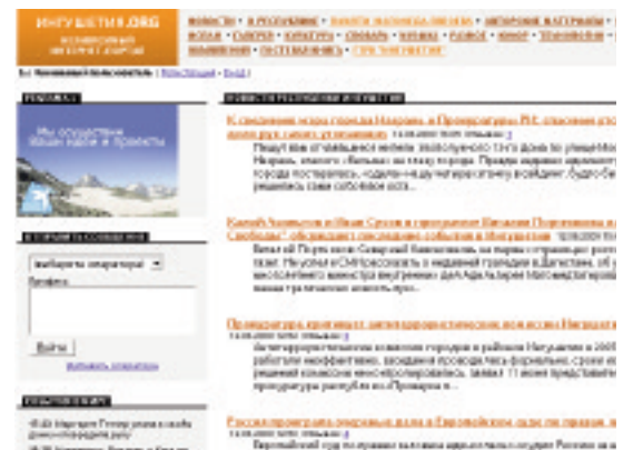
Capture d'écran du site Ingushetia.org (ancien Ingushetiya.ru )

Convocations policières, poursuites en tout genre (administratives, fiscales ou pour "extrémisme" et "incitation à la haine interethnique") pouvant aboutir à la fermeture d'une structure, ou d'un site, telles sont les difficultés de ceux qui transgressent la loi du silence. Les médias risquent également l'expulsion, l'impossibilité de trouver des locaux, d'être imprimés et distribués, etc.