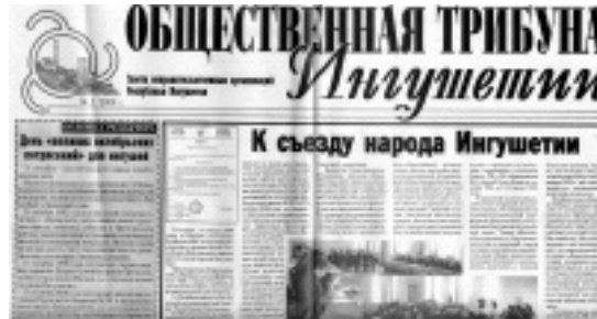
Obchestvennaia Tribuna Ingushetii

En Ingouchie, plusieurs ONG se sont regroupées pour publier un mensuel, Obchestvennaia Tribuna Ingushetii . Conçu initialement comme une tribune pour ces organisations et pour inciter la population à recourir à leurs services, il aborde des thèmes rarement traités dans les médias officiels. Imprimé et diffusé sans aide publique, et dénué de but lucratif, le mensuel est diffusé en partie gratuitement.