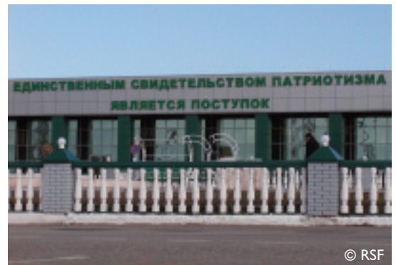
Citation de R. Kadyrov sur le fronton de l'aéroport de Grozny : "Seuls les actes témoignent du patriotiste"

Il est primordial de soutenir le développement des initiatives de la société civile, des médias locaux ou centraux, couvrant l'actualité de ces républiques. Il faut aussi que les médias étrangers y reviennent. A cet égard, la levée du statut de KTO pour la Tchétchénie pourrait faciliter le travail des professionnels de la presse dans la région. Ce n'est pas parce que la guerre est finie que la société civile est sauvée. Elle est au contraire en péril. Le spectre de la guerre semble écarté, mais les populations sont livrées à elles-mêmes, ou plutôt à leurs maîtres, qui n'ont pas le souci, et parfois les moyens, de mettre en œuvre et de défendre les libertés les plus fondamentales. C'est pourquoi la présence de la presse est primordiale pour instaurer un dialogue entre des groupes figés dans un face-à-face haineux et pour tenter de limiter la radicalisation, religieuse notamment, de la population.