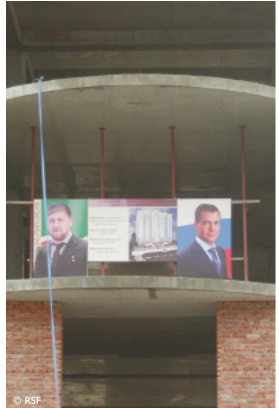
Grozny, portraits du Président tchétchène R. Kadyrov et du Président russe D. Medvedev sur immeuble en construction.

Héritage de l'époque soviétique ou conséquence de la guerre et de la déstabilisation, la presse locale est avant tout officielle ou considérée comme telle. Les médias indépendants (privés ou créés par des associations ou des organisations non gouvernementales) sont très minoritaires, souvent autofinancés et exposés aux pressions.