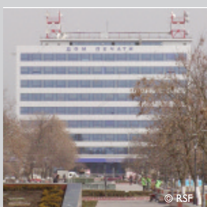
Maison de la presse, Grozny, Tchétchénie.