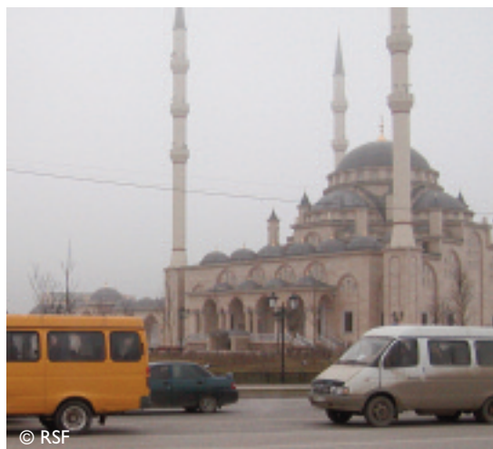
Mosquée - Centre-ville de Grozny

Selon lui, le gouvernement actuel s'est donné plusieurs objectifs, dont la moralisation de la société. Les médias sont priés d'y contribuer activement. C'est ce qui explique "la création de la chaîne Pout [religieuse], mais aussi de la diffusion de films et d'informations réalisés pour soutenir le développement moral de la population via la presse", souligne le ministre.