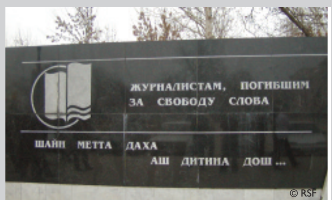
Monument à la mémoire des journalistes, Grozny, Tchétchénie.