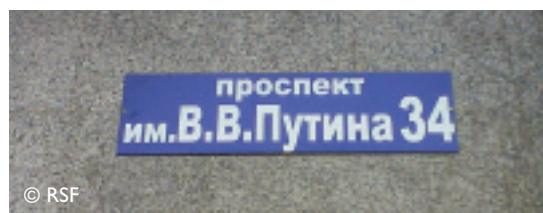
Avenue V.V. Poutine - Grozny

Une équipe de jeunes journalistes, rencontrée à Grozny, à la veille de la Journée de la femme (8 mars 2009), abonde dans le même sens. A une question sur l'évolution de la situation en Tchétchénie, l'une des jeunes femmes répond simplement : "Ça saute aux yeux, non ? Il suffit de regarder la ville."