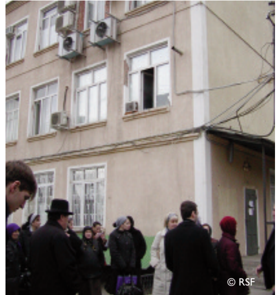
Rassemblement devant le ministère de l'intérieur ingouche, Nazran